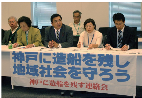
国土交通省へ要請 (11月5日：衆議院議員会館)

弁当またはお椀にご飯をよそい、茶碗を持って空いているテーブルを確保して、お茶を注ぎやとと食事ができます。結構こだわりのある人はメニューをその都度変えて1階を選んでいきます。最近ではメタボ対策でカロリーが少ないB定食が人気のようです。 しかし、フライものが多いとか、代わり映えのしない料理だとかの苦情も聞かれます。一度に大量に作らないといけないので料理する人は大変だと思いが、もう一工夫が欲しいところです。(兵庫・J)